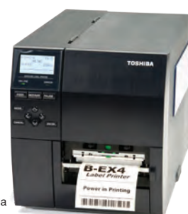
Gama superior de impressoras industriais serie B-EX4 com preço de gama media para uma ampla variedade de aplicações.